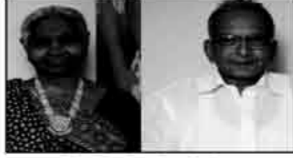
માતુશ્રી મોઠીબેન નેણશી ડોસા ગડા લાકડીયા