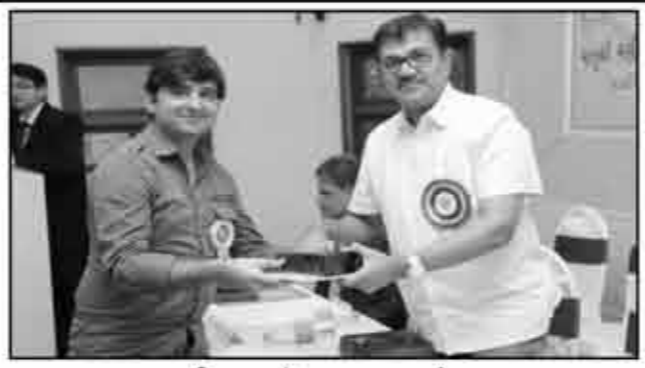
શ્રી ગાગોદર યુવા મંચ