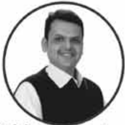
શ્રી દેવેન્દ્ર ફડલાવીસજી મુખ્ય મંત્રી મહારાષ્ટ્ર રાજ્ય