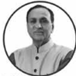
શ્રી વિજયભાઈ રૂપાણી મુખ્ય મંત્રી ગુજરાત રાજ્ય

સમસ્ત ગુજરાતી સમાજને એક છત્ર નીચે ભેગા કરી સમાજ ઉત્કર્ષનો એક વિનમ્ર પ્રયાસ એટલે ગુજરાતી એન્રીચમેન્ટ ઓર્ગેનાઈઝેશન