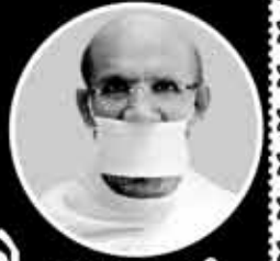
પૂજ્ય આ.શ્રી ભાવગુરુ

શ્રી વાગડ વિશા ઓસવાળ સ્થાનકવાસી જૈન સંઘ-ચીરાબજાર સંચાલિત