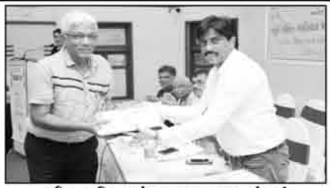
શ્રીયુત મિત્ર મંડળ (ભયાઉ) મુંબઈ