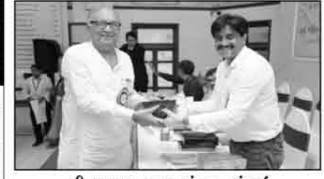
શ્રી મનફરા યુવક મંડળ, મુંબઈ