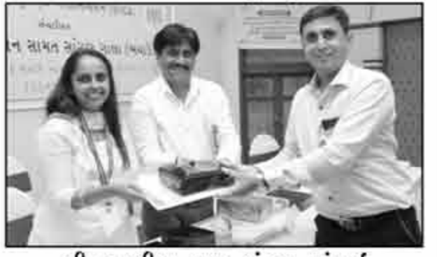
શ્રી લાકડીયા યુવક મંડળ, મુંબઈ