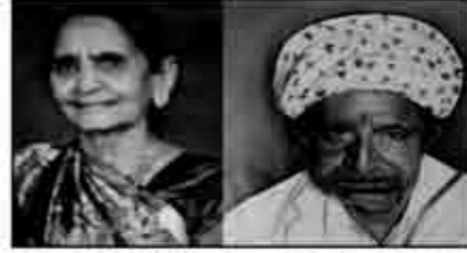
માતુશ્રી પીમઈબેન લખીદીર ગોવર ગીદરા હલરા