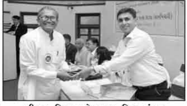
શ્રી રવ વિશા ઓશવાળ મિત્ર મંડળ