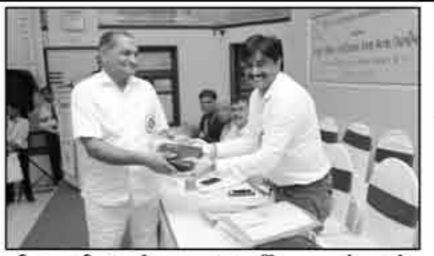
શ્રી ઘાણીથર શ્વેતામ્બર મૂર્તીપૂજક જૈન સંઘ