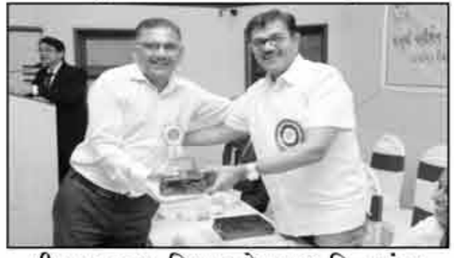
શ્રીયુત કકરવા વિશા ઓશવાળ મિત્ર મંડળ