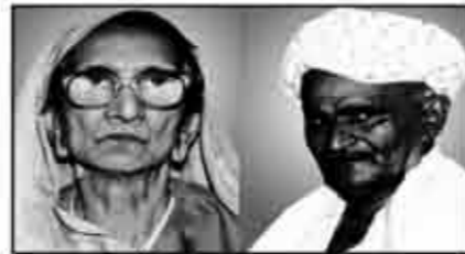
માતુશ્રી મીઠીબેન અરજા ભયુ ગાલા લાકડીયા