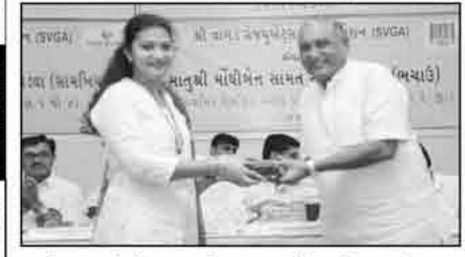
શ્રી સુવઈ વિશા ઓશવાળ જૈન મિત્ર મંડળ,