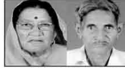
માતુશ્રી મોઠીબેન ગેલા નરપાર છેડા ગાગોદર